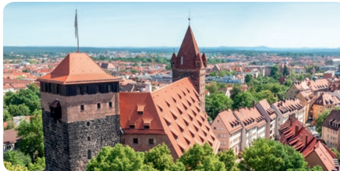
Sicht auf das Wahrzeichen von Nürnberg – die Kaiserburg