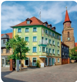
Die historische Altstadt von Fürth