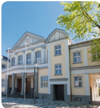
Die historische Festhalle in Viersen