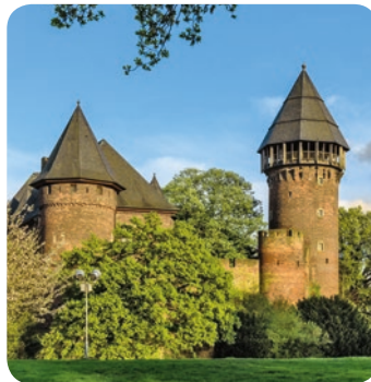
Burg Linn in Krefeld