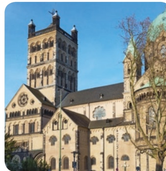
Quirinus-Münster Kirche in Neuss