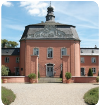
Schloss Wickrath in Mönchengladbach

Montag bis Freitag von 9:00–16:00 Uhr Einfach und unbürokratisch!