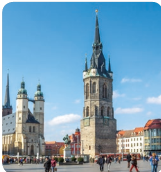
Der Marktplatz von Halle an der Saale