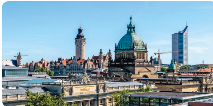
Die Skyline von Leipzig