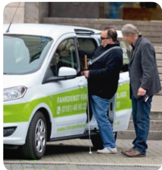
Unsere Blindenmobifahrer im Einsatz

Montag bis Freitag von 9:00–16:00 Uhr Einfach und unbürokratisch!